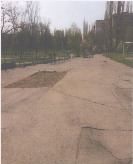
Вигляд майданчика на сьогоднішній день: