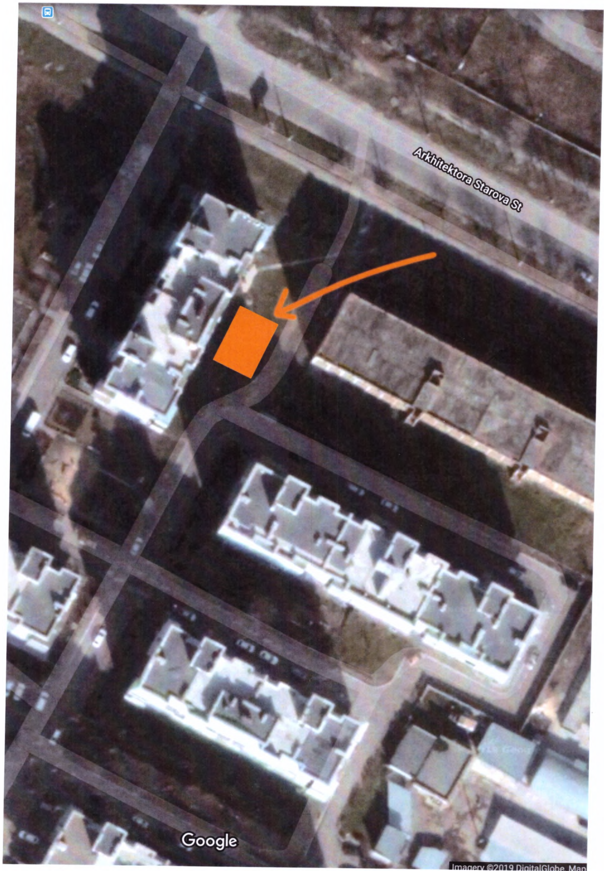
Додаток 1 – топографічний план-схема прилеглої території.