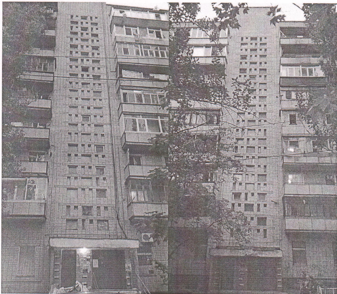
10 під'їзний житловий будинок проспект Корабелів 12