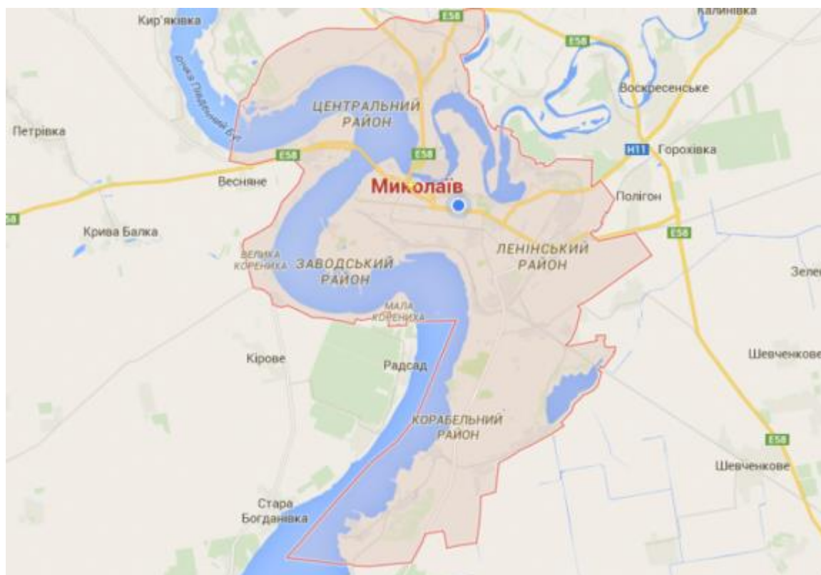
Рисунок 2.1 – карта міста Миколаїв

Місто Миколаїв - місто в Україні, обласний центр Миколаївської області, центр Вітовського і Миколаївського районів. Миколаїв розташований в Північному Причорномор'ї в гирлі річки Інгул, де вона впадає до Південного Бугу, за 65 кілометрів від Чорного моря. Це потужний політичний, діловий, індустріальний, науково-технічний, транспортний та культурний центр. Площа міста за даними головного управління статистики в Миколаївській області станом на складає 259,8 км 2 .