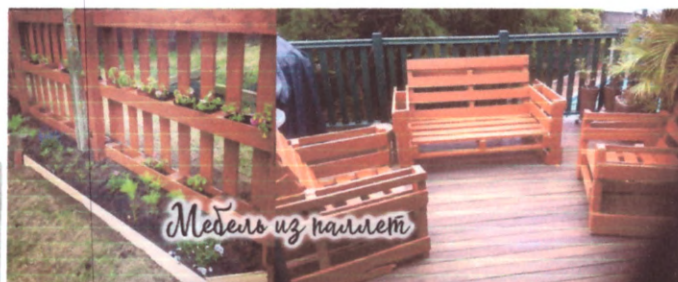
Мебель из паллет