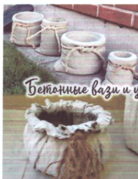
Бетонные вазы и урны

Територія, на якій будуть розміщені виготовлені на майстеркласах елементи благоустрою та озеленення